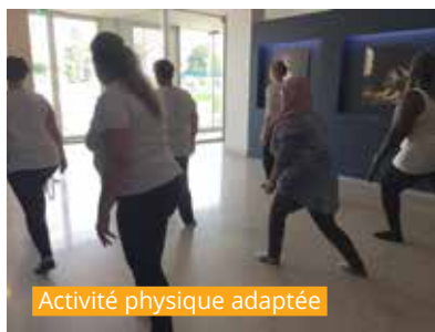
Activité physique adaptée