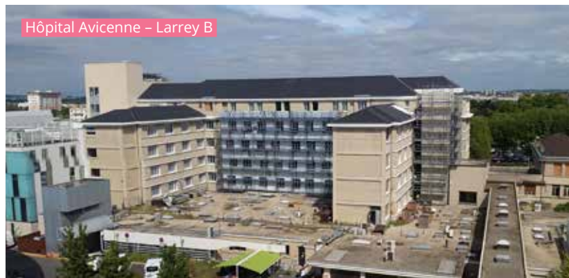
Hôpital Avicenne – Larrey B

La livraison est prévue pour le 1 er semestre 2018. Le vaste chantier de restructuration du bâtiment Dominique Larrey entre donc dans sa troisième phase. Démarré en janvier 2016, le projet Larrey porte une double ambition : préserver l'architecture d'origine de l'hôpital et proposer un fonctionnement optimal des services dans le bâtiment.