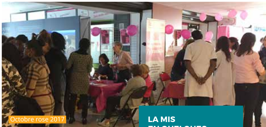
Octobre rose 2017

Acteur de prévention en santé engagé, la MIS mobilise tout au long de l'année les équipes soignantes du GH et les partenaires associa-